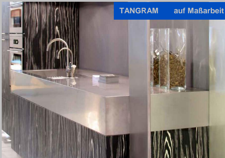
185 mm gekantet

TANGRAM auf Maßarbeit in verschiedenen Größen