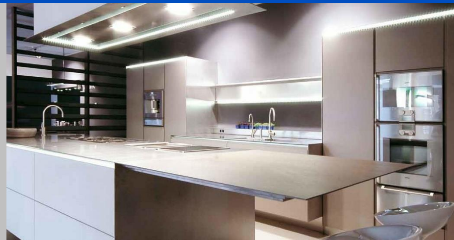
4 mm massiv