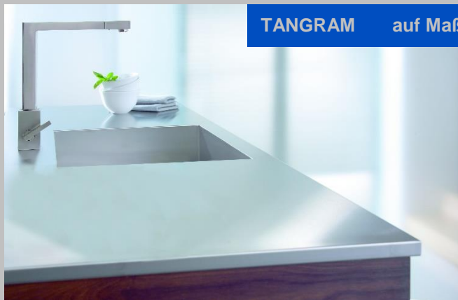
TANGRAM auf Maßarbeit in verschiedenen Größen